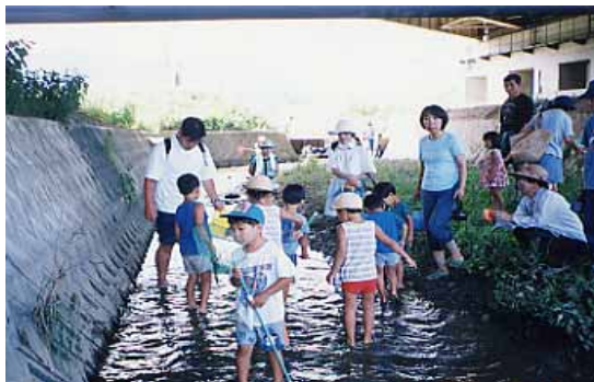
安心して子供たちが遊べる水辺に。