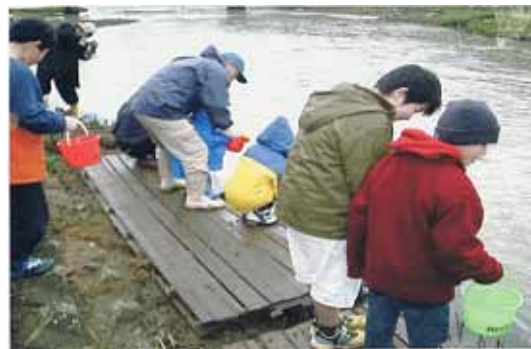
鮭の稚魚放流「西川鮭を呼び戻す」