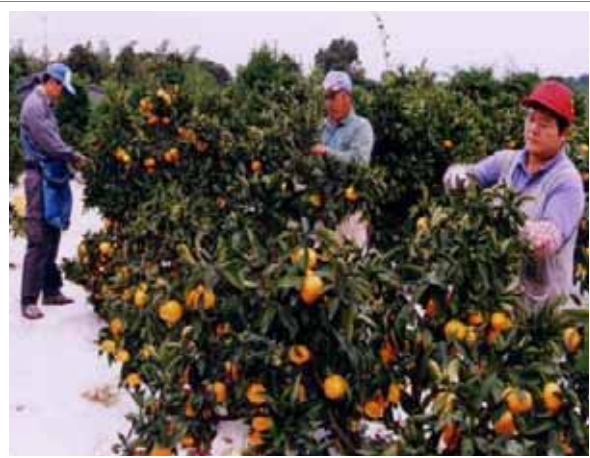
みかんの収穫状況