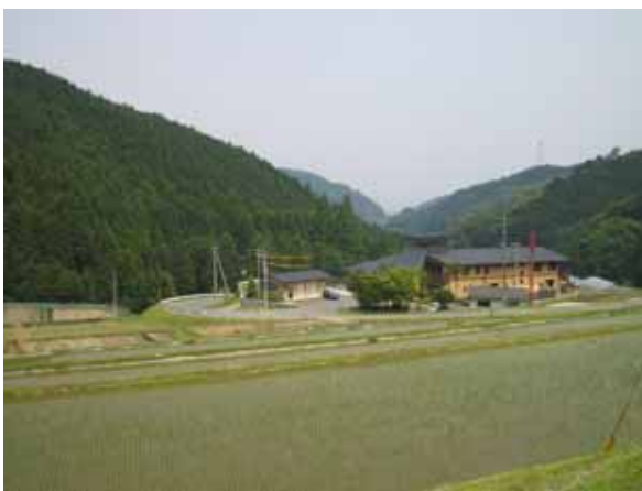
・ 鳥栖市の農山村地域の風景