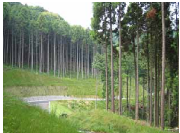
・ 除間伐、枝打ち実施状況