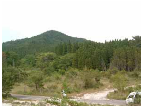
林道奥平野線(起点側からの植林状況)