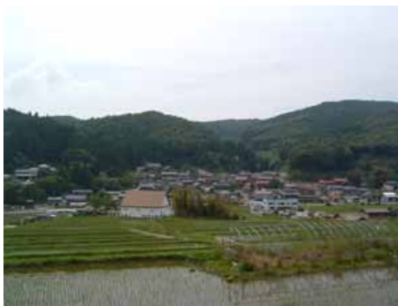
市道天川～杉宇土線(天川側からの風景)