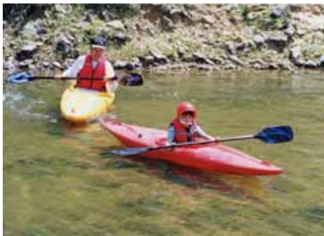
かっぱ塾・親子カヌー教室