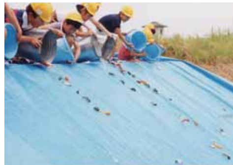
みずべの楽校・幼稚園児のコイの稚魚放流