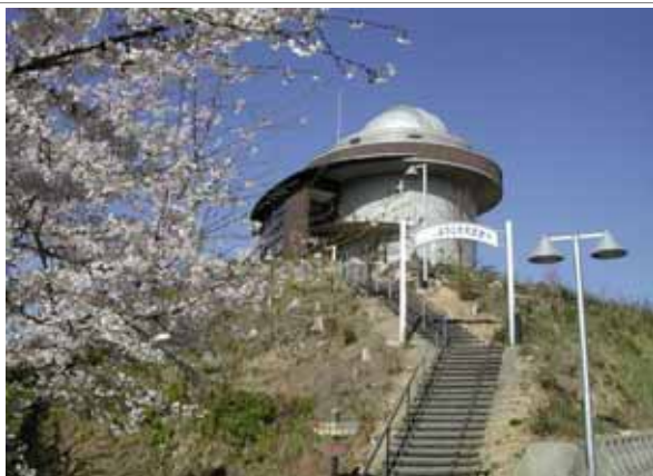
さかもと八竜天文台