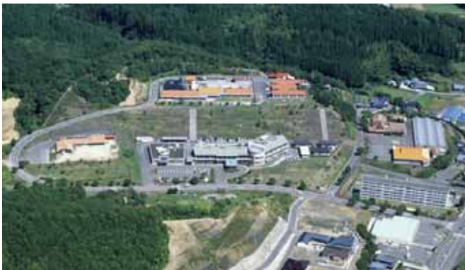
福祉施設群の「ひだまりの里」(写真中央が病院)