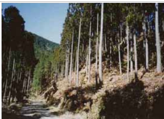
林道整備により間伐が進んでいる民有林