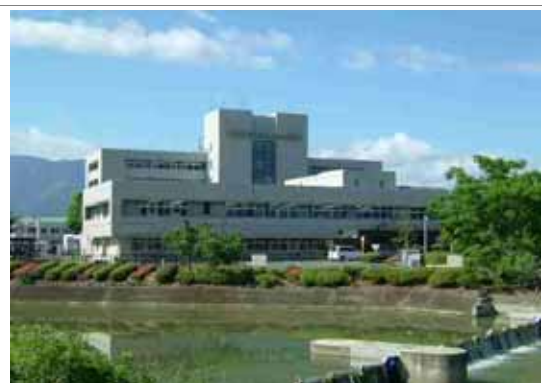
地域救急医療の核となる公立多良木病院