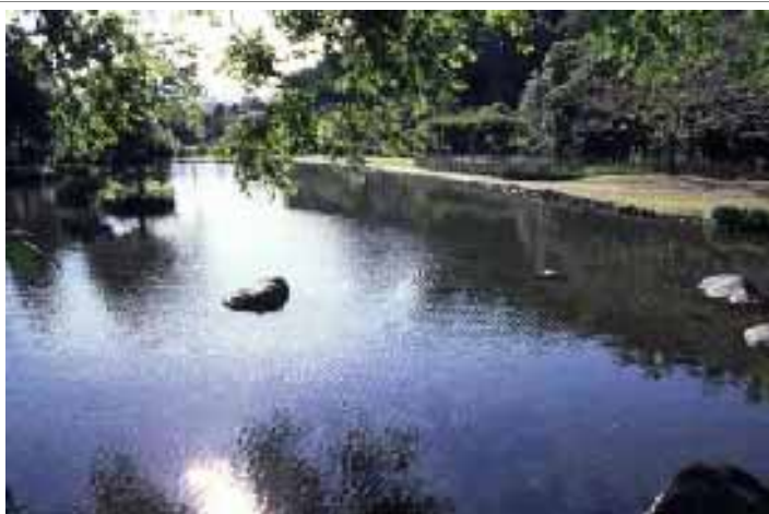
はけみや (八景水谷公園)