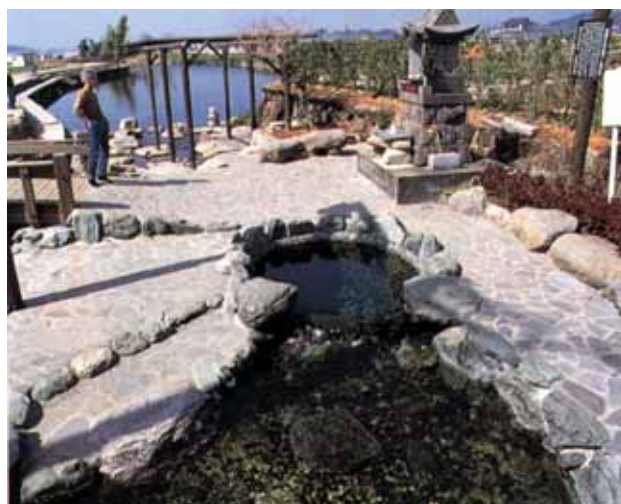
尾田の丸池（熊本名水百選）