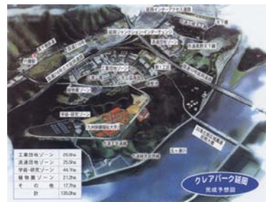
クリアパーク延岡完成予想図