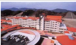
九州保健福祉大学