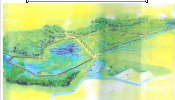
国指定天然記念物 川南湿原植物群落 整備イメージ