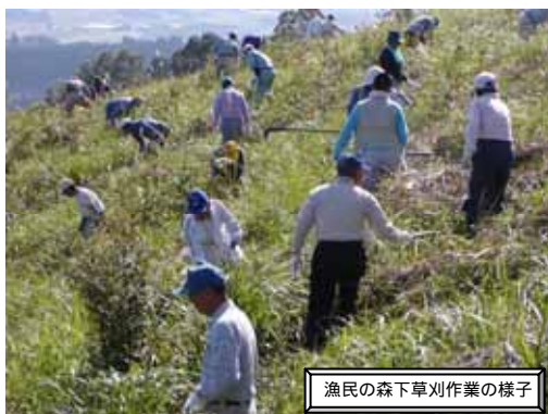
漁民の森下草刈作業の様子