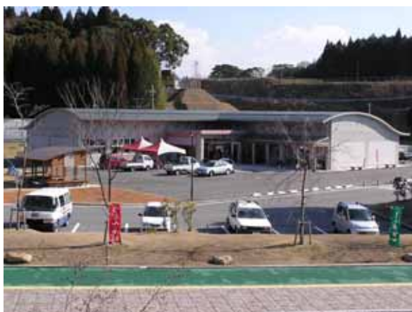
チェスト館（活性化交流施設）