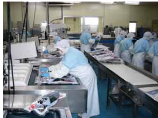
「あづまの鯨王」ブランド化確立をめざし、海外への販路拡大が著しいHACCP加工場