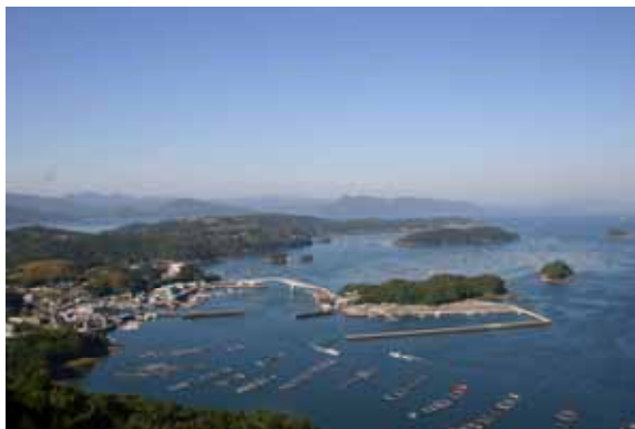
雲仙天草国立公園内の景勝地に浮かぶブリ養殖場（薄井・本浦地区）