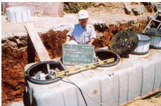
汚水処理施設（公共下水道・浄化槽）の整備