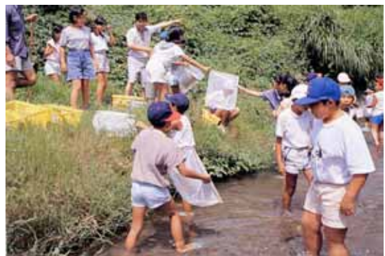
清流と水辺の再生