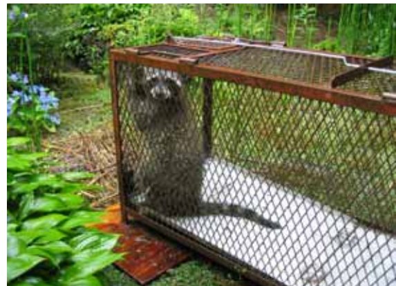
【捕獲されたアライグマ】