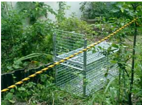
【都市の民家の庭に設置されたワナ】