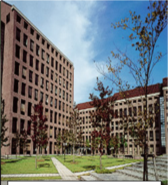
兵庫県立大学播磨科学公園都市キャンパス