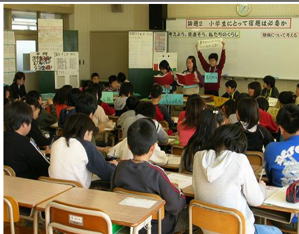
小学校におけるディベートの授業風景

適用される規制の特例措置： ・特区研究開発学校の設置（教育課程の弾力化） ・市町村負担教職員任用の容認