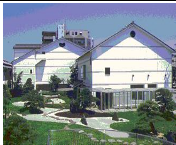
柿衛文庫(俳諧コレクション)と美術館