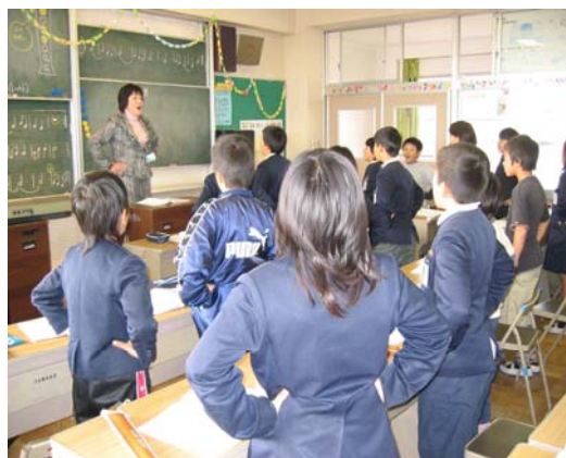
小学校における専科指導