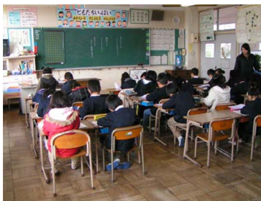
小学校における少人数学級