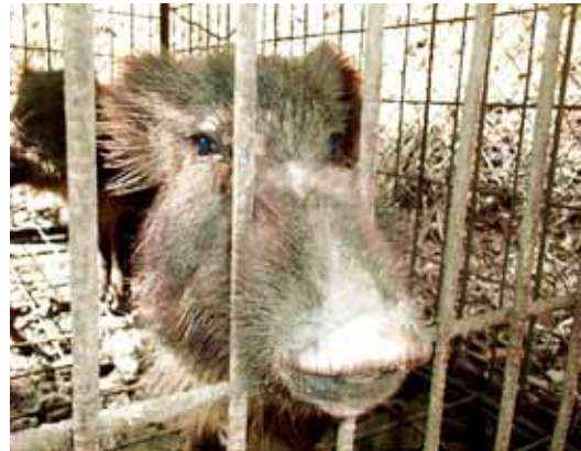
【捕獲されたイノシシ】