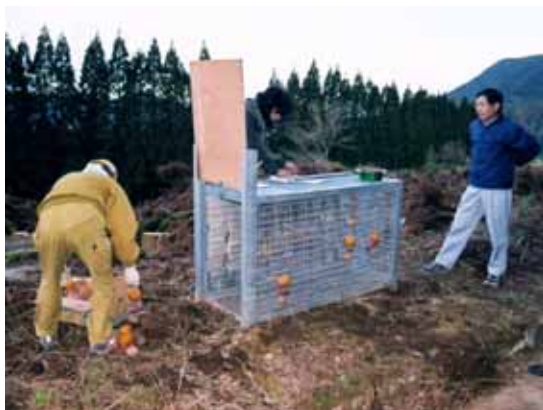
【箱わなによる有害鳥獣捕獲】