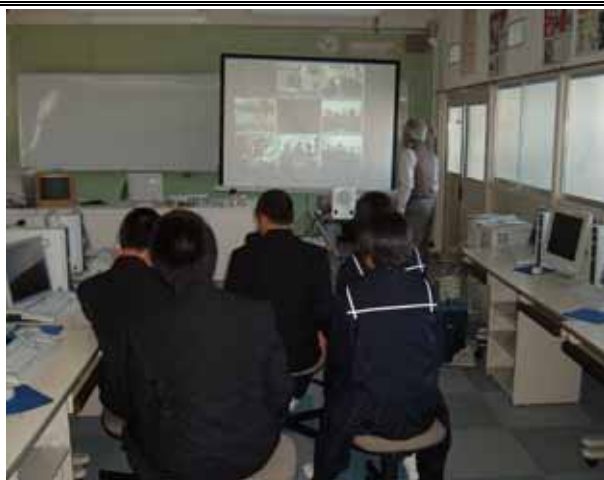
（多地点でのTV会議システムによる交流）