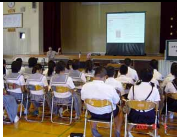
（小中学校児童生徒の共同学習）