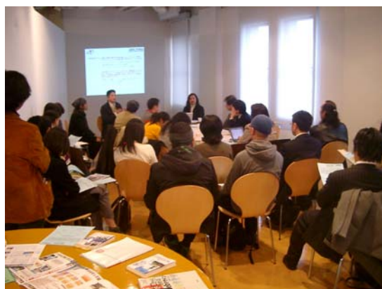
クリエイティブ Biz ヨコハマフォーラム ネットワーキングイベント