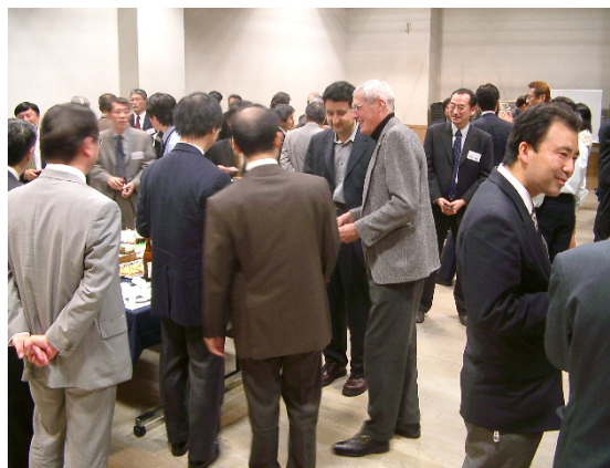
新横浜 IT クラスター交流会