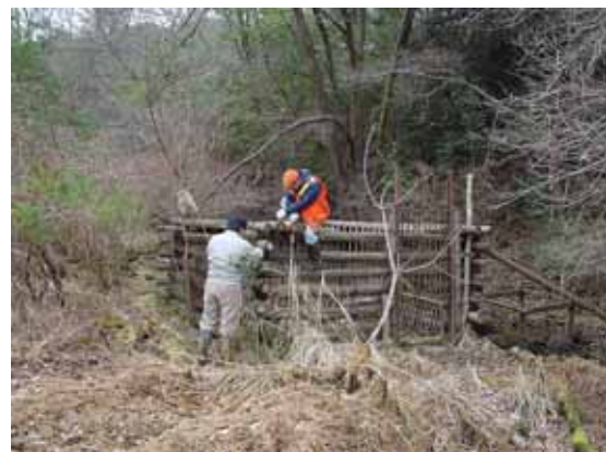
箱わなの設置作業