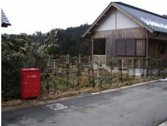
電気柵で囲まれた滞在型市民農園