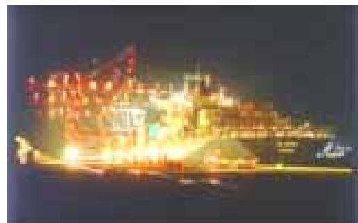
コンテナターミナル（夜間荷役）