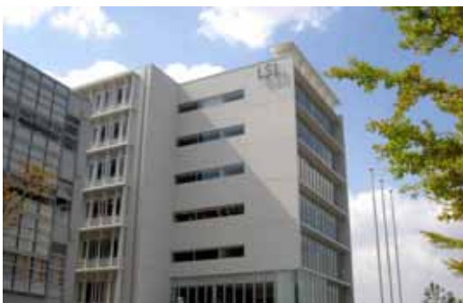
福岡システムLSI総合開発センター