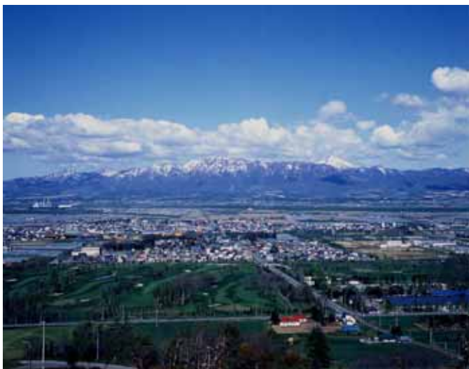
爾波（にわ）山から見た奈井江町の全景