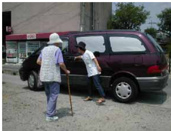
NPO 団体による福祉有償運送