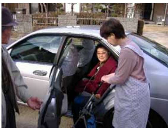
NPOの輸送サービス実施状況