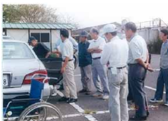
NPOの運転会員の講習受講状況