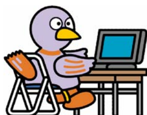
埼玉県のマスコット コバトン

適用される規制の特例措置 : ・ 講座修了者に対する初級システムアドミニストレータ試験の一部免除 ・ 講座修了者に対する基本情報技術者試験の一部免除