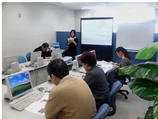
「ITパークこうとう」パソコン教室