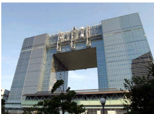
テレコムセンター