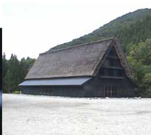
利賀芸術公園の合掌造り劇場 「新利賀山房」