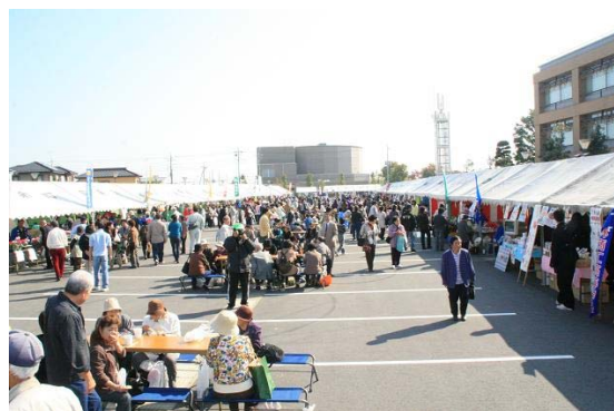
【 産業祭 】