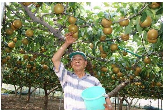
【 梨収穫 】