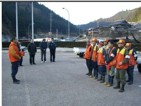
有害鳥獣駆除に出発する時の様子