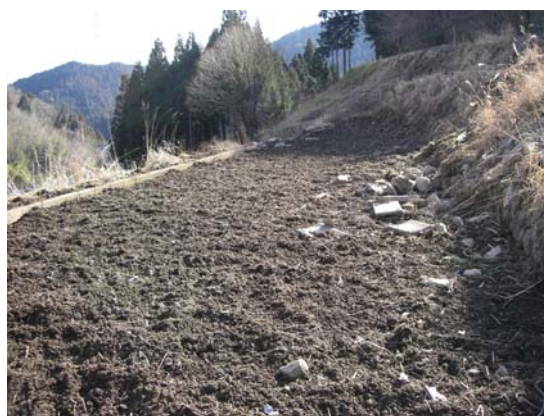
芋畑が猪の被害にあった後の様子