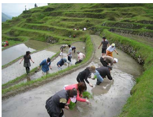
丸山千枚田での田植え風景