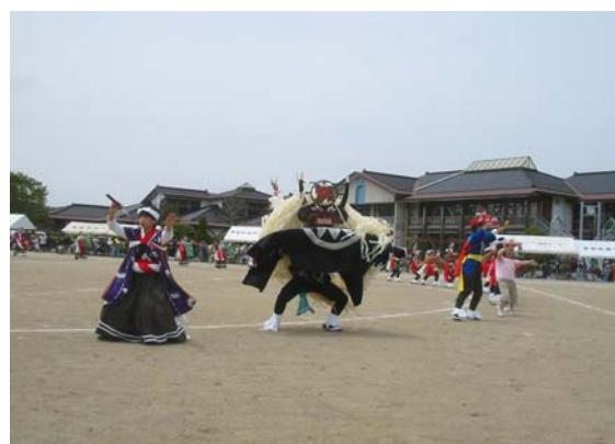
学校で地域の伝統芸能を継承