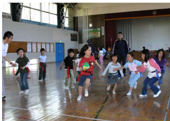
学校施設を活用した児童館活動