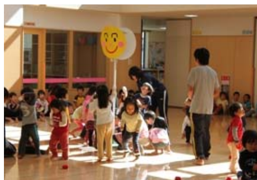
認定こども園における 運動会に向けた玉入れ練習