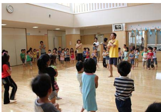
認定こども園における 異年齢活動・遊戯指導