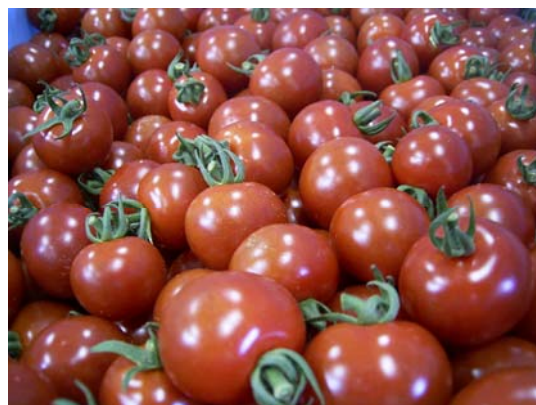
出荷を待つ大蔵ミニトマト