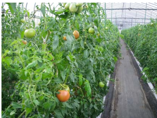
雨よけハウスで栽培させる 大蔵甘熟トマト