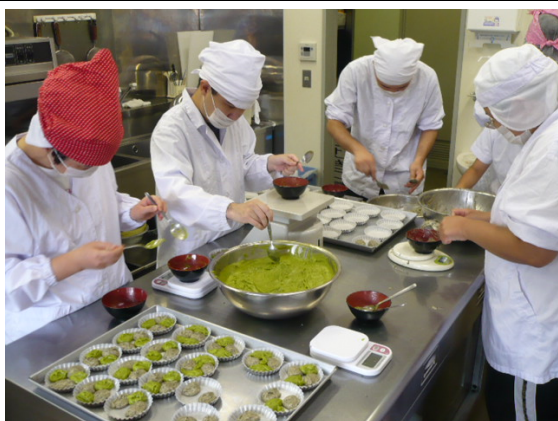
事業所内での生産活動