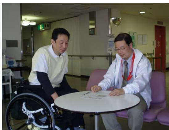
利用者に情報提供をするサービス管理責任者