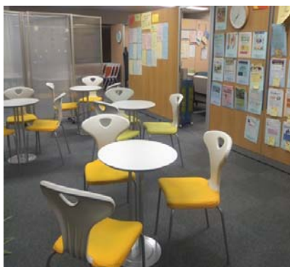
よこはま若者サポートステーション内の風景