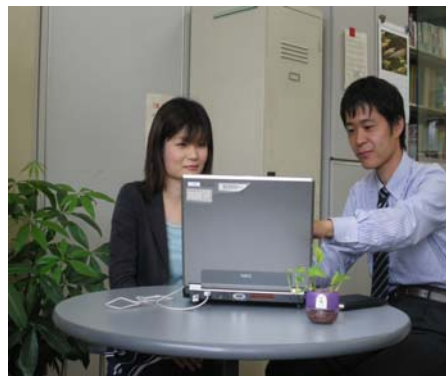
インターネットを使用した職業紹介の様子