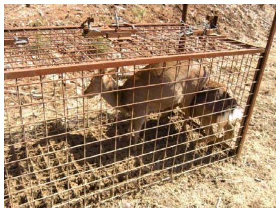
檻にかかったニホンシカ