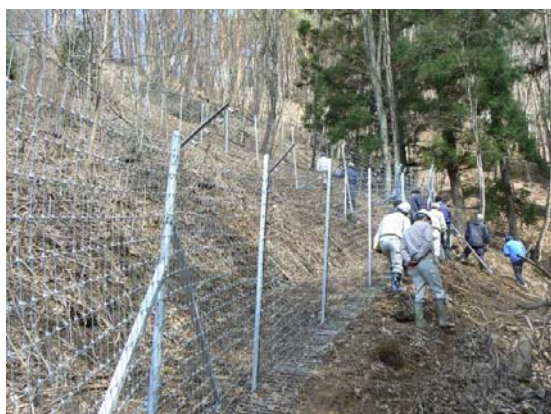
里山に設置された防護柵