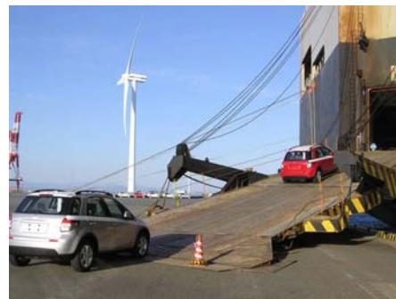
自動車運搬船への積み込み