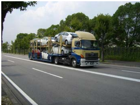
自動車を輸送するトレーラ