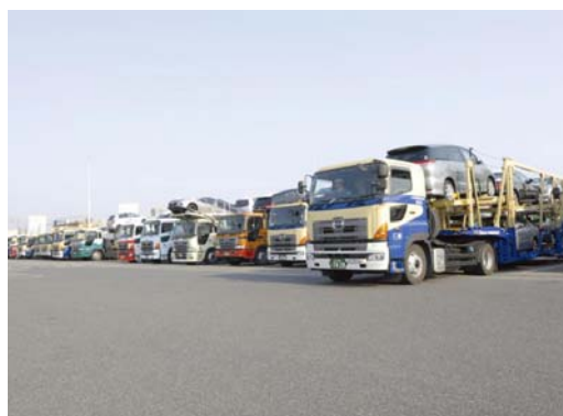
港や工場へ出発するトレーラ