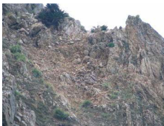
食害による被害状況