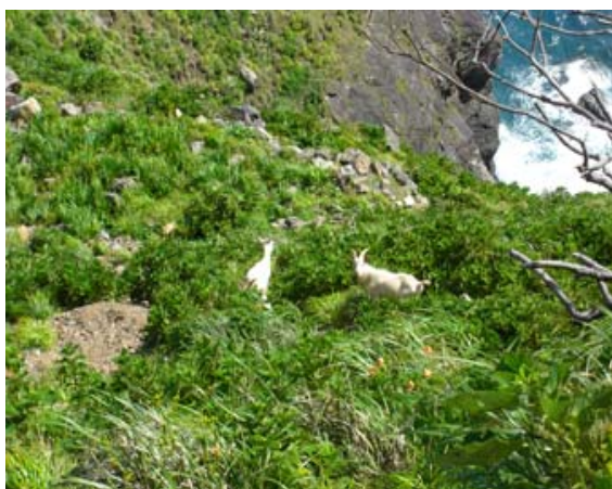
曾津高崎崖地におけるノヤギ