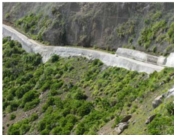
食害による表層土壌の侵食