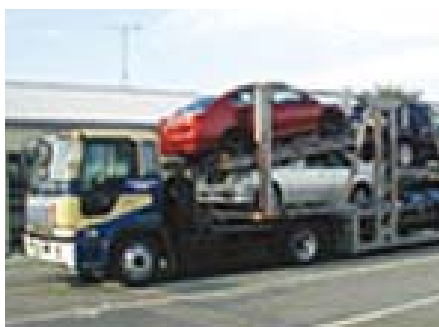
自動車を積載したトレーラ