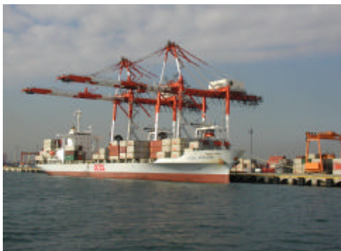
【川崎港コンテナターミナル】