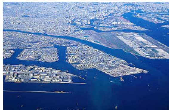
【羽田空港に隣接する京浜臨海部】