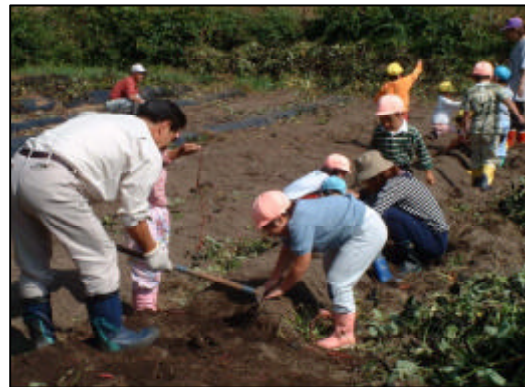
【サツマイモの収穫風景】