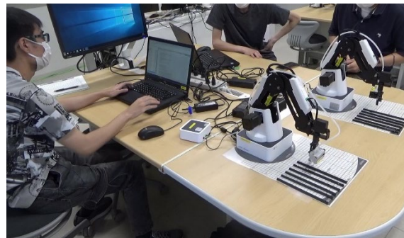
長野県南信工科短期大学校 「ロボット制御実習」