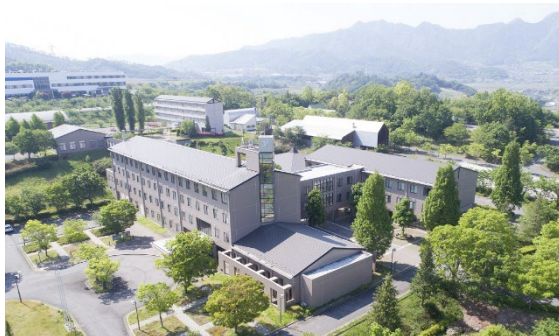
長野県工科短期大学校