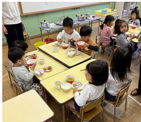
保育所の給食風景②