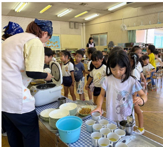
保育所の給食風景①