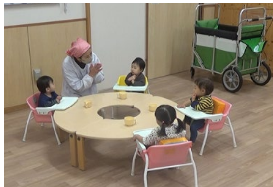
「なかよくいただきます」風景